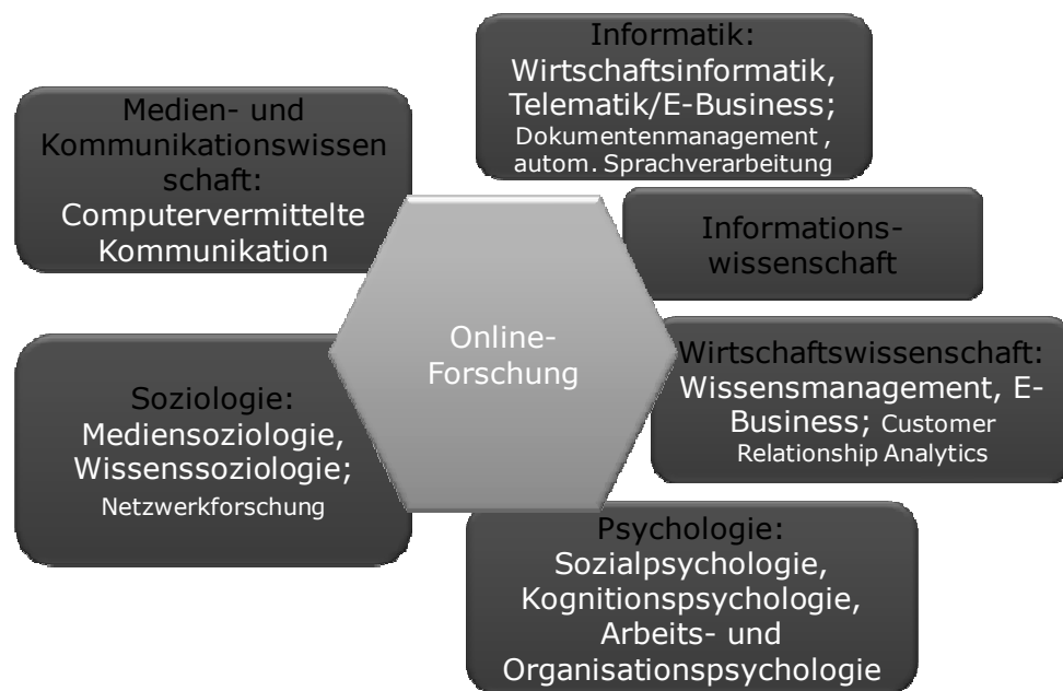
Abb.1: Interdisziplinäre Bezüge der Online-Forschung: Fächer, beispielhafte Fachbereiche und Einzelfelder

Online-Forschung weist als interdisziplinäres Forschungsfeld Bezüge auf zu klassischen soziologischen Fachbereichen aber auch zu Fächern wie der Informatik oder der Psychologie. Im internationalen Wissenschaftskontext haben sich mehrere Fächer gebildet, die ebenfalls mit Online-Forschung in Verbindung stehen, die aber im deutschen Sprachraum kein begriffliches Pendant haben oder (noch) nicht stark verankert sind.